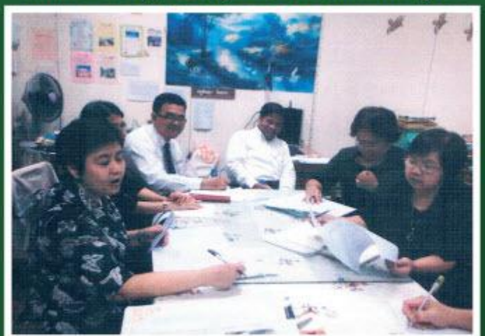
คณะครูของแต่ละกลุ่มสาระวางแผนการขับเคลื่อนปรัชญา ของเศรษฐกิจพอเพียง