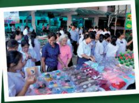
จัดกิจกรรมตลาดนัดอาชีพให้แก่นักเรียนโรงเรียนสตรีศรีสุริโยทัย