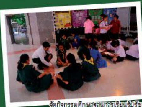
จัดกิจกรรมศึกษารู้นักเรียนรู้ปรัชญาของเศรษฐกิจพอเพียงให้แก่นักเรียนโรงเรียนยุคนนภาวศิวทยาและโรงเรียนนิพัทธ์วิวัฒนา