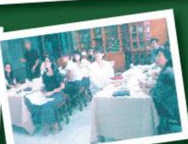
คณะครูของแต่ละกลุ่มสาระแลกเปลี่ยนเรียนรู้หลักปรัชญาของเศรษฐกิจพอเพียง