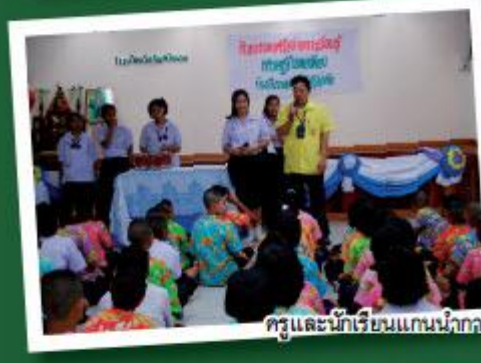
ครูและนักเรียนแกนนำการขับเคลื่อนปรัชญาของเศรษฐกิจพอเพียงขยายผลให้แก่นักเรียนโรงเรียนวัดจันทร์นอก