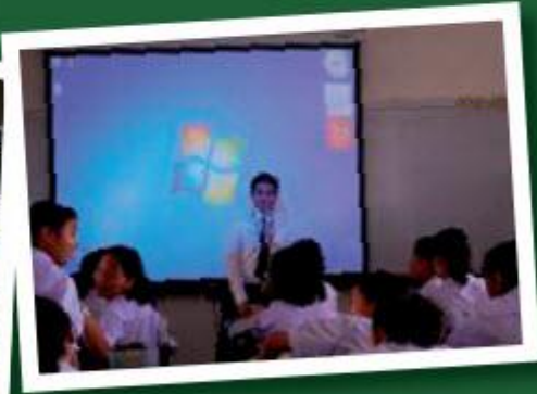
จัดการเรียนการสอนตามหลักปรัชญาของเศรษฐกิจพอเพียงภายในห้องเรียน