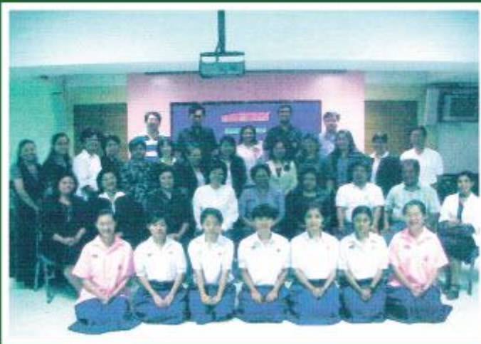
คณะกรรมการสอดคนศึกษาร่วมเป็นคณะกรรมการ ในการจัดทำวิสัยทัศน์ของโรงเรียนสตรีศรีสุริโยทัย