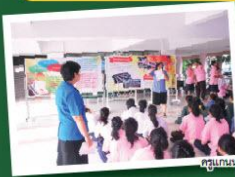
ครูแกนนำขยายผล ให้กับนักเรียนแกนนำขับเคลื่อนปรัชญาเศรษฐกิจพอเพียง