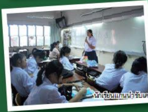
นักเรียนแกนนำขับเคลื่อนปรัชญาของเศรษฐกิจพอเพียงขยายผลความรู้ให้แก่สมาชิกภายในห้องเรียน