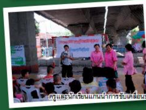
ครูและนักเรียนแกนนำการขับเคลื่อนปรัชญาของเศรษฐกิจพอเพียงจัดกิจกรรมขยายผลการเรียนรู้เศรษฐกิจพอเพียงให้แก่ชุมชนบ้านแบบ