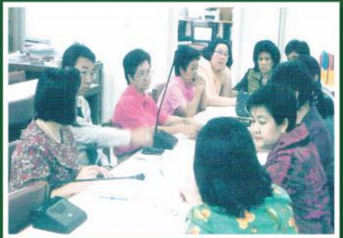
ผู้บริหารประชุมหัวหน้ากลุ่มสาระการเรียนเพื่อวางแผน ในการขับเคลื่อนปรัชญาของเศรษฐกิจพอเพียงของโรงเรียนสตรีศรีสุริโยทัย