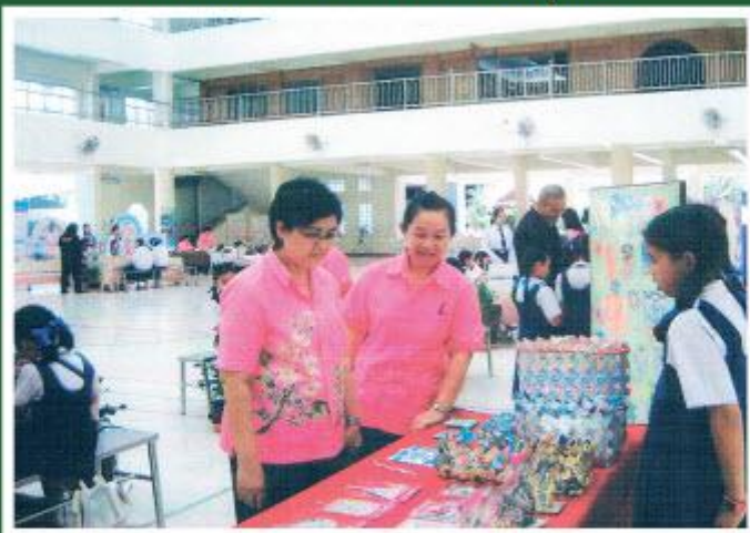
บุคลากรศึกษาคูงานการจัดการเรียนรู้ตามหลักปรัชญาของเศรษฐกิจพอเพียง ต้นทางการศึกษา ณ ศูนย์โรงเรียนมารดาพิทักษ์ อำเภอเมือง จังหวัดจันทบุรี